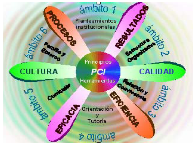
Figura 3: Proyecto de Calidad Integrado