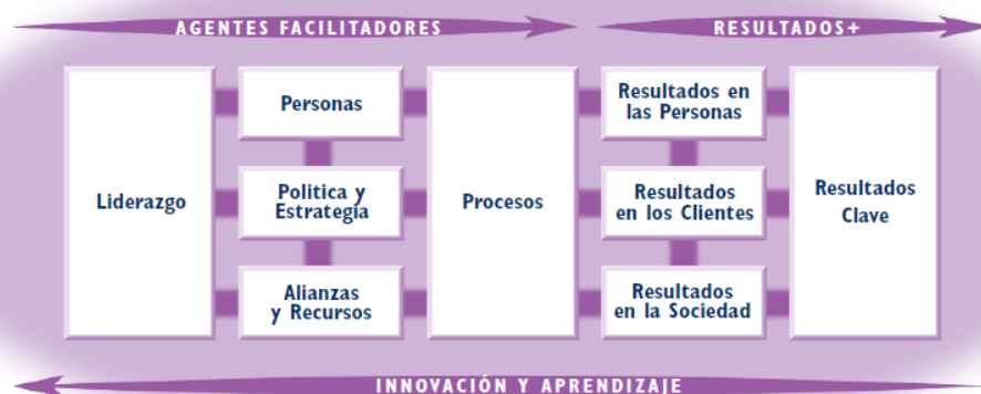
Figura 4: Modelo de la Fundación Europea para la Gestión de Calidad.

© El Modelo EFQM de Excelencia es una marca registrada